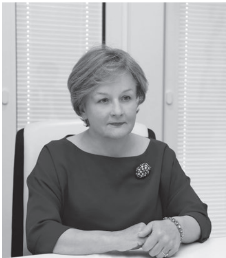
LAIMA LIUCIJA ANDRIKIENĖ

Esu Tėvynės Sąjungos narė-steigėja. Sąjūdžio narė nuo pirmosios jo susikūrimo akimirkos. Moku 5 kalbas. Tikiu, jog mano patirtis būtų naudinga Lietuvos interesų gynyboje.